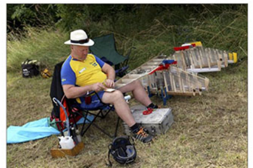
Au-delà du pilotage, l'aéromodéliste travaille le bois, le plastique ou encore le métal pour améliorer les qualités de son avion.