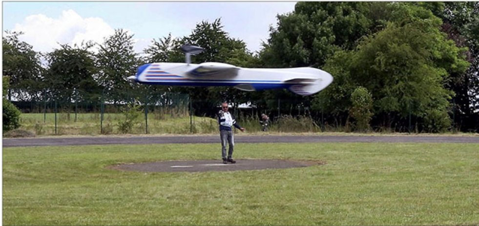
Séance "acrobatique" pour ce compétiteur qui doit effectuer plusieurs figures imposées sous les yeux de plusieurs juges en bord de piste.

Le combat – « une nouveauté cette année ici » – consiste en un duel dans le ciel. Le but du jeu ? « Couper avec l'hélice la bande-