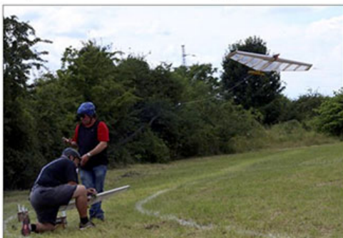
En vol circulaire, la catégorie "combat" est l'une des plus spectaculaires. Mieux vaut porter un casque !