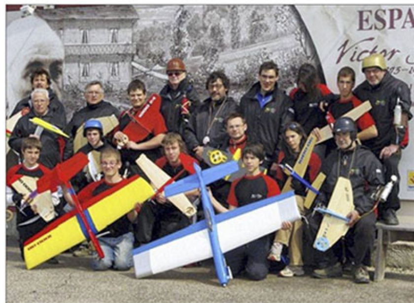
Les membres du CMBL se sont investis dans la préparation des Grands Prix à l'espace Victor-Tatin de Landres.

Quatre catégories sont inscrites au Grand Prix de France.